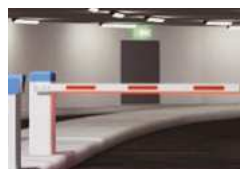
▪ Barrière levante