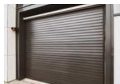
▪ Rideau à enroulement

Pour toute demande spécifique, n'hésitez pas à nous consulter !