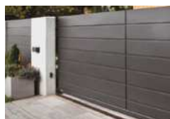
▪ Portail résidentiel