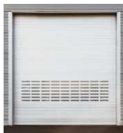
▪ Rideau métallique