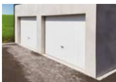
▪ Porte basculante