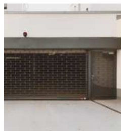
▪ Grille à enroulement