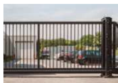
▪ Portail coulissant