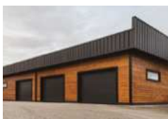
▪ Porte de garage