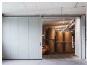
▪ Porte coulissante coupe-feu