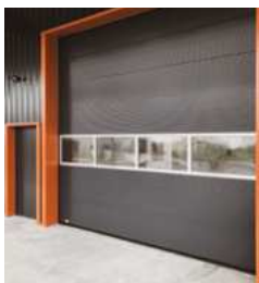
▪ Porte sectionnelle