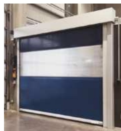
▪ Porte rapide