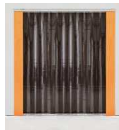
▪ Porte à lanières