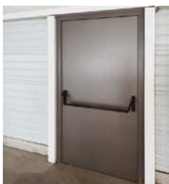
▪ Bloc porte métallique